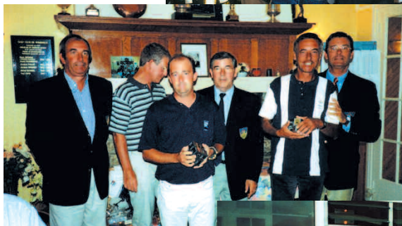
Lors d'une remise de prix des 60 compétitions organisées chaque année