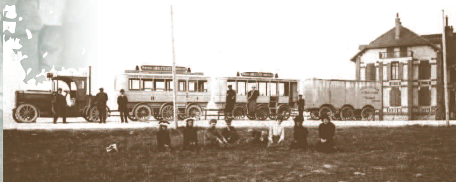
Le Train Renard devant l'hôtel Cosmopolite.

Les moyens de communication sont nombreux et faciles : tramways électriques allant de Boulogne au terrain de jeu ; trains jusqu'à la gare d'Aubengue ; trains Renard reliant Wimereux à Audresselles.