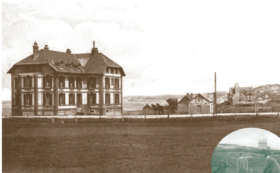
L'Hôtel Cosmopolite et les navettes devant le Café Golf Pavillon.

L'hôtel Cosmopolite situé à la Pointe aux Oies abrite provisoirement le clubhouse. Il s'appellera successivement l'hôtel "Cosmopolite et du Golf" puis "l'hôtel du Golf".