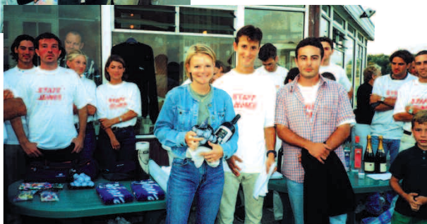
La relève est assurée avec la très originale Coupe des Jeunes