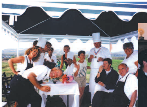
Amitié, convivialité, gastronomie et golf réunis pour le 10 ème anniversaire de la Coupe Santé Bonheur !

Que nos enfants et petits-enfants puissent fêter, comme nous l'avons fait, le 200 ème anniversaire, en jouant par exemple la 120 ème "Cora", la 110 ème "New Beaujolais Golf Cup" pour terminer par la "Santé Bonheur" !