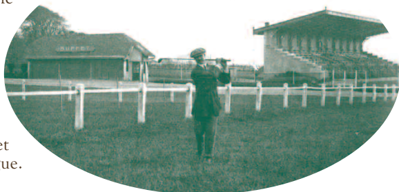
Sur le parcours du Boulogne Golfing Society à l'Inquéterie.