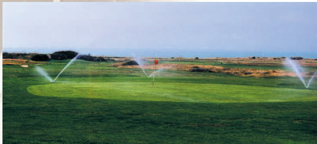
Depuis 1998, c'est Versailles...