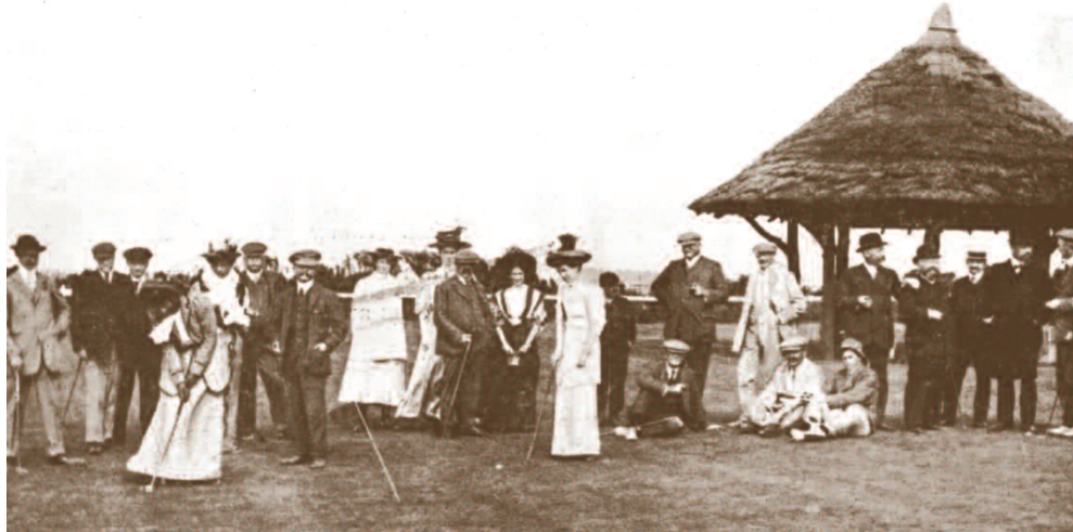
La "gentry" devant l'abri du putting green.